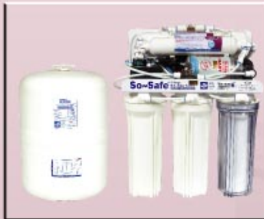
SSRO75Q 5-Stage Standard