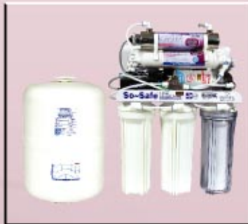
SSRO75QUV 6-Stage with UV